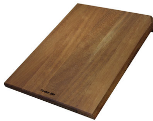
Planche de découpe coulissant Iroko 8656 001